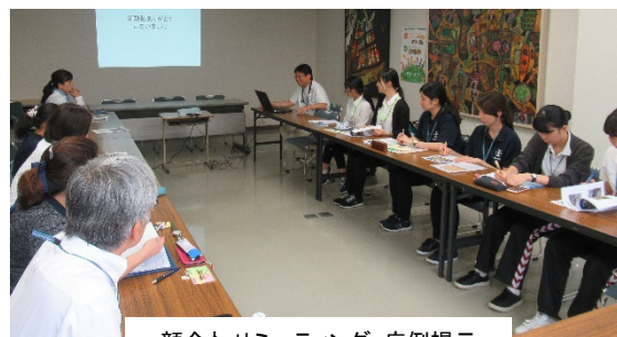
顔合せミーティング・症例提示