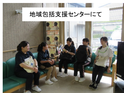
地域包括支援センターにて