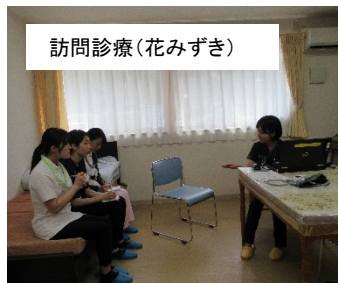
訪問診療(花みずき)