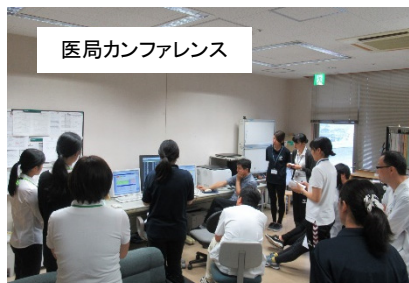
医局カンファレンス