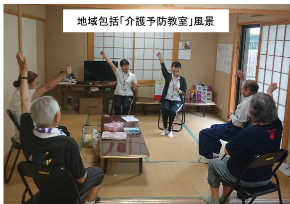
地域包括「介護予防教室」風景