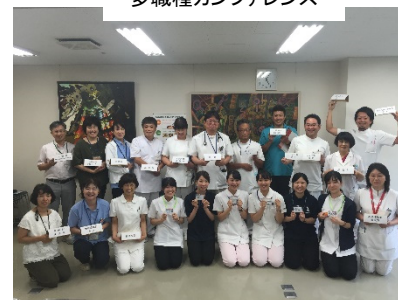
多職種カンファレンス