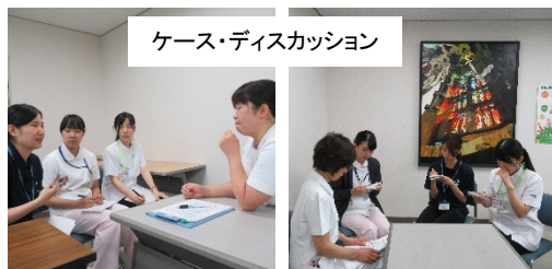
ケース・ディスカッション