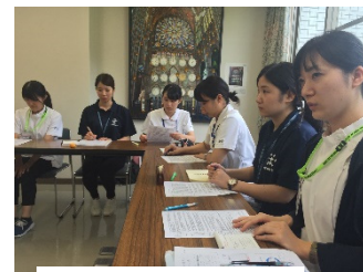
多職種カンファレンス